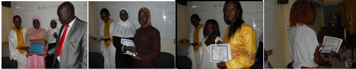
Les lauréates du concours recevant leurs prix (un ordinateur et des bons de formation)

Après l'atelier, les invités se sont retirés laissant la place aux candidates inscrites au concours pour s'affronter. Après une heure de combat intellectuel, les résultats ont été annoncés et les lauréates primées.