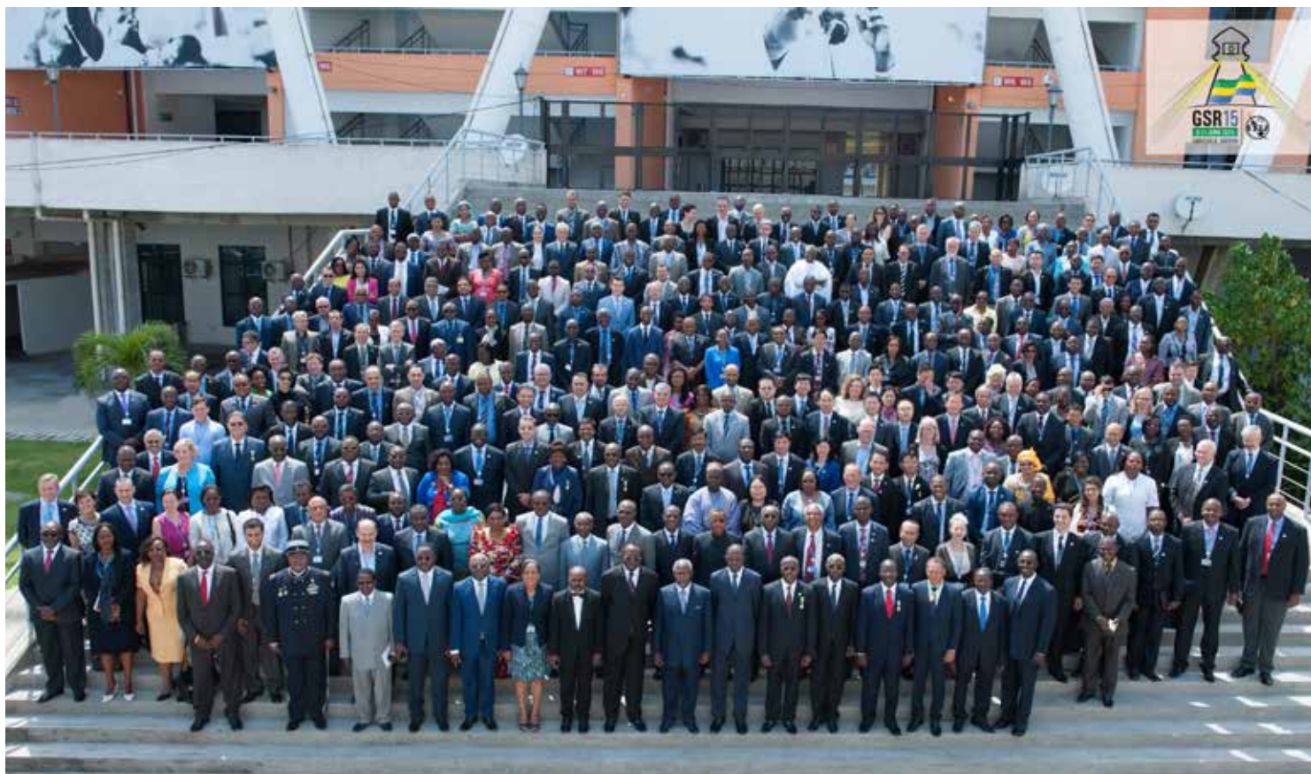
ГСР, июнь 2015 года