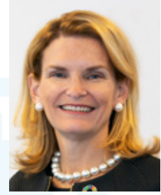
السيدة دورين بوغدان-مارتن، مديرة مكتب تنمية الاتصالات، الاتحاد الدولي للاتصالات

وتشكل المبادئ التوجيهية لأفضل الممارسات الصادرة عن الندوة العالمية لمنظمي الاتصالات لعام 2020 إطاراً من أجل أنماط وسياسات تنظيمية متدرجة مع رسم المستقبل للصناعة والهيئات التنظيمية. وتوفر المبادئ التوجيهية صورة عامة ورؤية استراتيجية مع تحديد خطوات ملموسة نحو تمكين الهيئات التنظيمية من مواصلة الإصلاح التنظيمي من أجل توفير أسواق رقمية شاملة ومزدهرة.