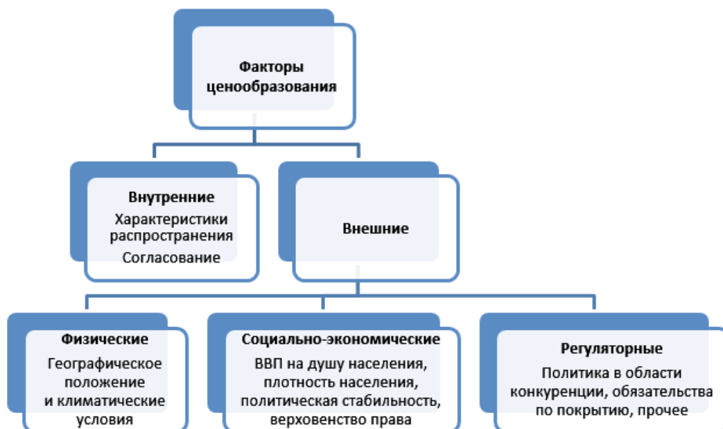
Рисунок 1: Факторы, влияющие на установление цен за использование спектра