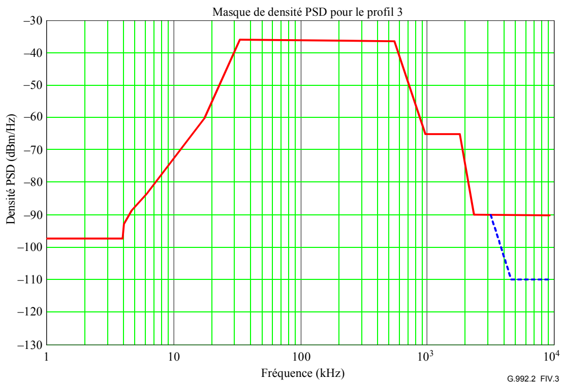
Figure IV.3/G.992.2 – Masque de densité PSD aval à conformation spectrale pour le profil 3