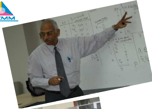
لمحة عن مركز CATI التابع للجنة SKMM