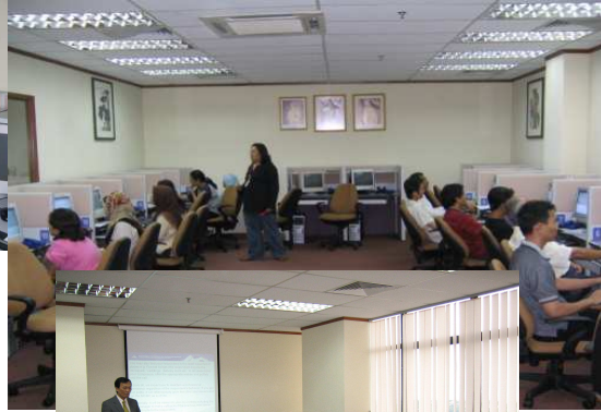
لمحة عن مركز CATI التابع للجنة SKMM