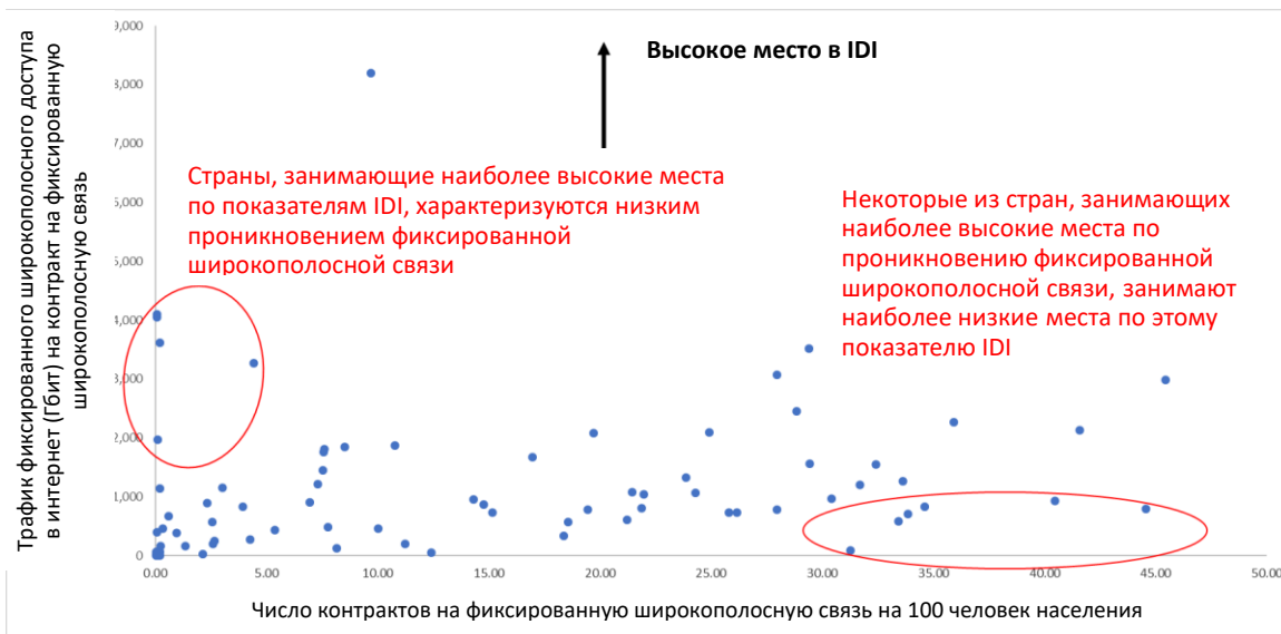
График 3 – Трафик фиксированного широкополосного доступа в интернет на число контрактов на фиксированную широкополосную связь и проникновение фиксированной широкополосной связи

Еще одним примером является добавленный новый показатель "Трафик фиксированного широкополосного доступа в интернет на число контрактов на фиксированную широкополосную связь". Если использовать в качестве знаменателя число контрактов на фиксированную широкополосную связь, страна, в которой число контрактов на фиксированную широкополосную связь невелико, но всеми ими обладают те, кто интенсивно пользуется данными 4 , займет более высокое место, чем страна с миллионами контрактов на фиксированную широкополосную связь при менее интенсивном использовании данных. На Графике 3 показано, что имеется группа стран небольшим числом контрактов на фиксированную широкополосную связь, которая займет высокое место по этому показателю, тогда как существует другая группа стран с большим числом контрактов на фиксированную широкополосную связь, которая займет очень низкое место по этому показателю. Это также будет неверным отражением уровня развития ИКТ в этих странах.