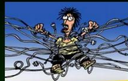
НАСТИКС В ИНТЕРНЕТЕ