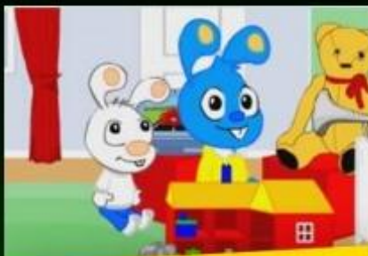
ИНТЕРНЕТ-МИР ЗАЙКИ ЮССЯ