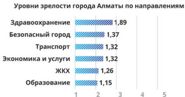
Рисунок 4 – Уровни зрелости города Алматы

В результате проведенного обследования были определены 6 направлений развития города и каждое из них получило свой балл (рисунок 4).