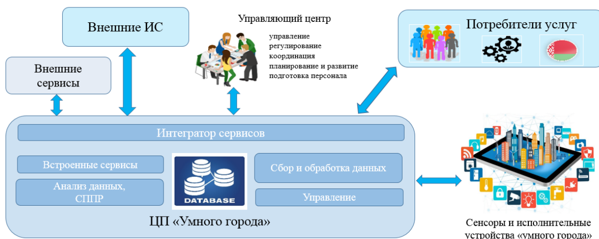
Рисунок 1 – Проект архитектуры цифровой платформы «умного города»

Цифровая платформа «умного города» реализует цифровую форму организации взаимодействия между поставщиками и потребителями с целью минимизации транзакционных издержек при поиске партнеров, товаров, услуг, организации платежей, заключении контрактов, монетизации, контроле исполнения договоренностей, арбитраже, оценке репутации участников, определении потребностей, внедрении новых решений и т.д. Единое информационное пространство определяет единые стандарты для информационных систем и цифровых сервисов, позволяет реализовать поэтапный системный подход к цифровой трансформации в интересах общества, органов управления и бизнеса. На рисунке 1 представлена проект архитектуры цифровой платформы.