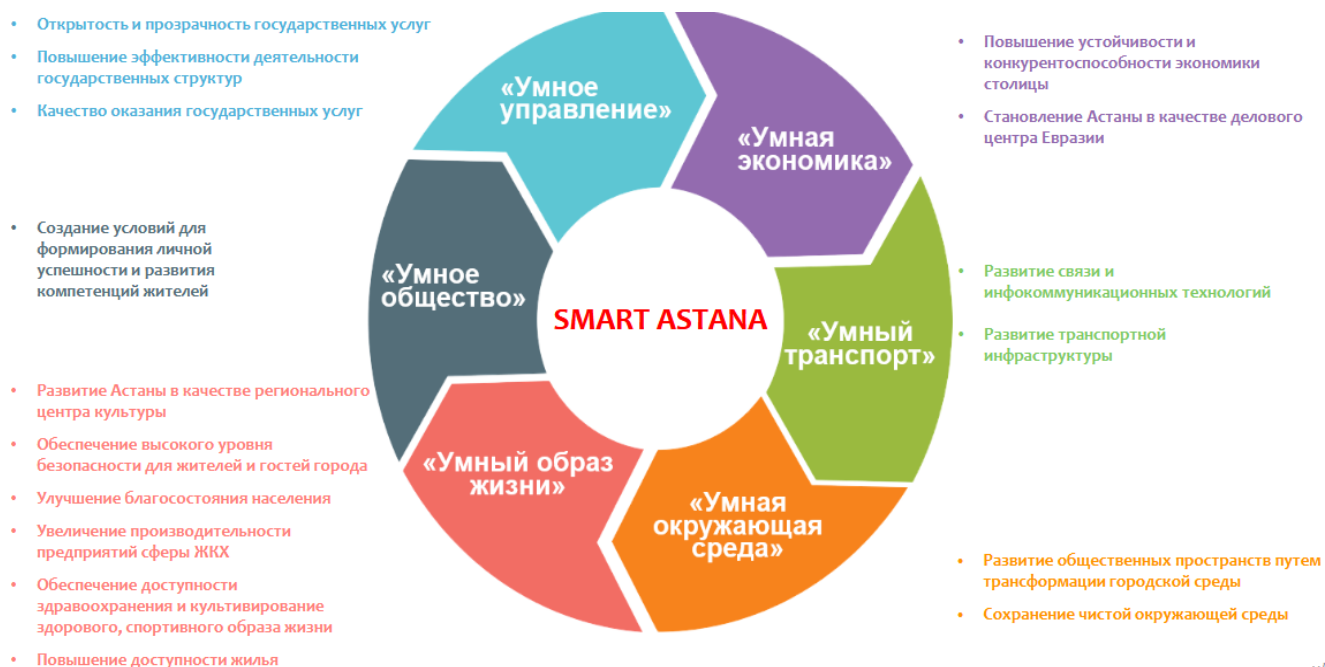
Рисунок 5 – Направления развития «умного города»

Также на сайте компании присутствует база данных стартап-проектов 25 .