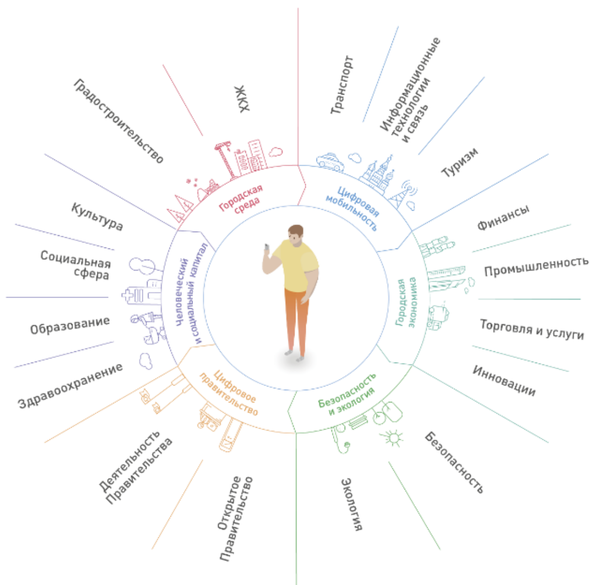
Рисунок 10 – Основные направления развития «умного города»

При разработке и внедрении решений «умного города» должны прослеживаться следующие сквозные технологии: