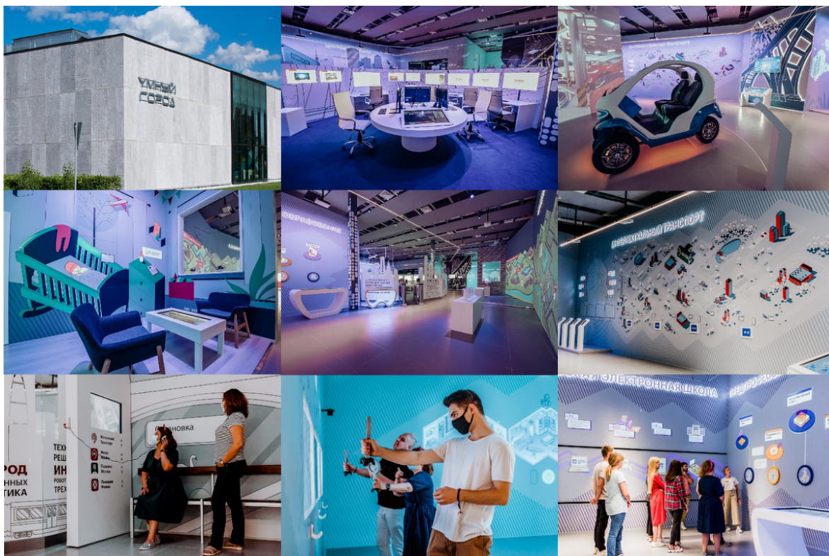
Рисунок 11 – Коллаж из фотографий, размещенных на официальной странице павильона

В 2018 году МСЭ был разработан документ «Применение Международных стандартов МСЭ-Т к «Умным устойчивым городам»: Москва 47 .