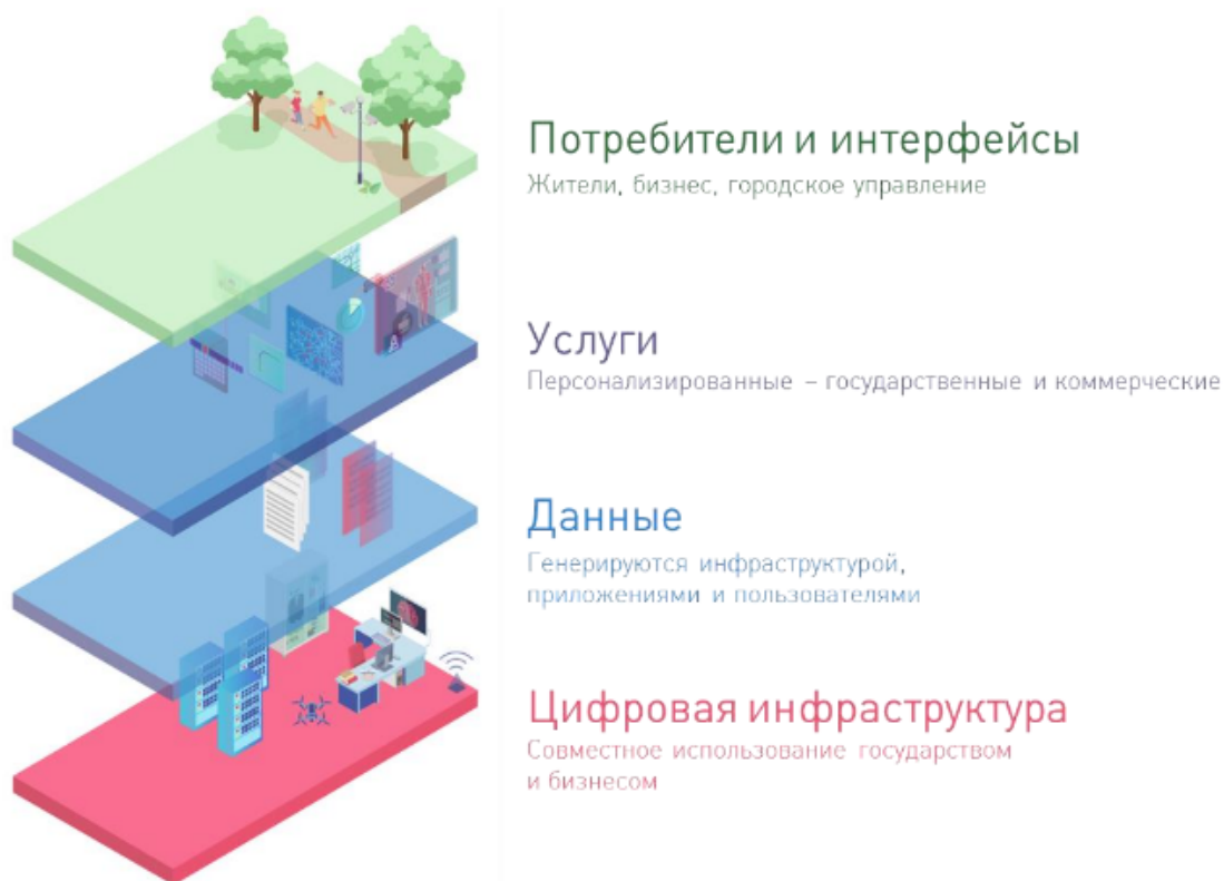
Рисунок 11 – Архитектура «умного города»

Архитектура «умного города» состоит из 4 уровней и представлена на рисунке 11.