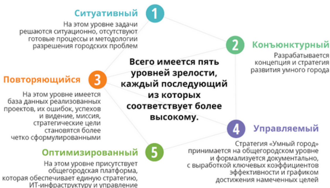
Рисунок 3 – Уровни зрелости развития

В результате проведенного обследования были определены 6 направлений развития города и каждое из них получило свой балл (рисунок 4).