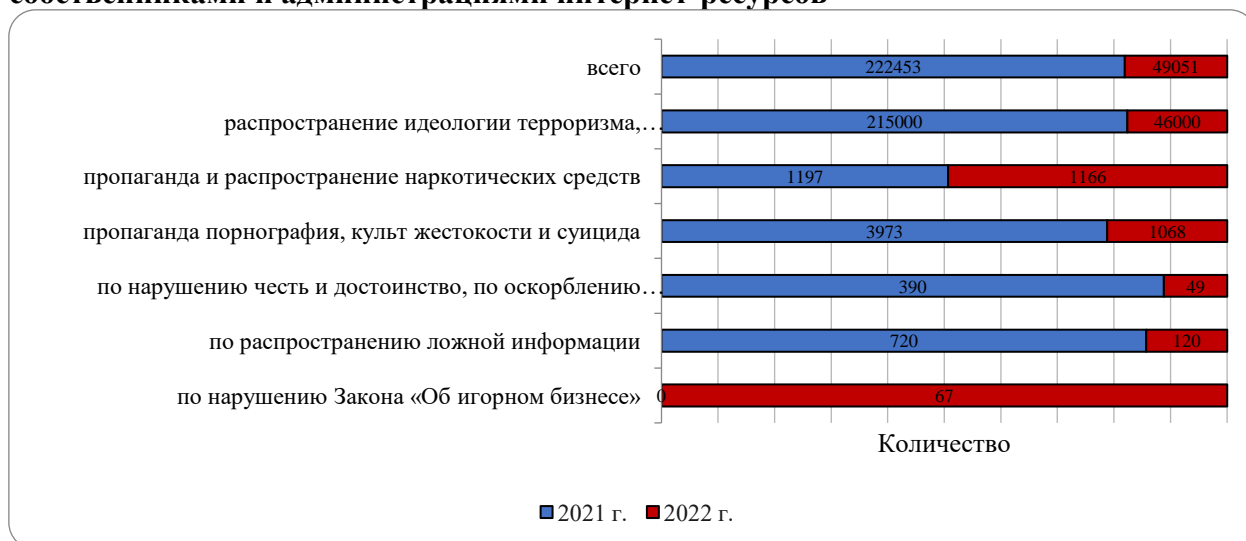
Диаграмма 1. Количество устраненных противоправных материалов по рекомендациям уполномоченного органа об устранении нарушений законодательства собственниками и администрациями интернет-ресурсов

Кроме того, в отчете отмечается, что государством принимается комплекс мер по профилактике и защите детей в онлайн-среде в части мониторинга и блокировки контента в интернет-ресурсе и/или интернет-ресурса, где происходят противоправные действия в отношении ребенка.