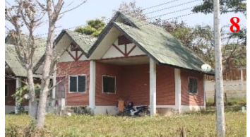
1. องค์การบริหารส่วนตำบลบ่อแก้ว 2. ร้านอาหารตามสั่ง 3. ร้านกาแฟ 4. ไร่สตอเบอร์รี่ 5. ร้านขายของชำ 6. สถานีอนามัยบ่อแก้ว 7. ร้านขายของชำ 8. บ้านพัก อบต.