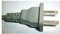
Tipo A, NEMA 1, 2 polos