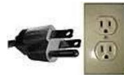
Tipo B, NEMA 5, 3 polos.