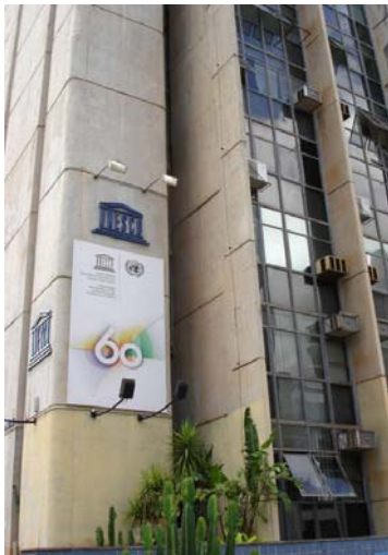
Oficina de la UNESCO en Brasília, Brasil