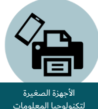
الأجهزة الصغيرة لتكنولوجيا المعلومات