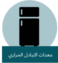
معدات التبادل الحراري