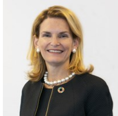
Sra. Doreen Bogdan-Martin Director Sector de Desarrollo de las Telecomunicaciones de la UIT

La Sra. Doreen Bogdan-Martin fue elegida Directora de la Oficina de Desarrollo de las Telecomunicaciones de la UIT el 1 de noviembre de 2018. Tomó posesión del cargo el 1 de enero de 2019.