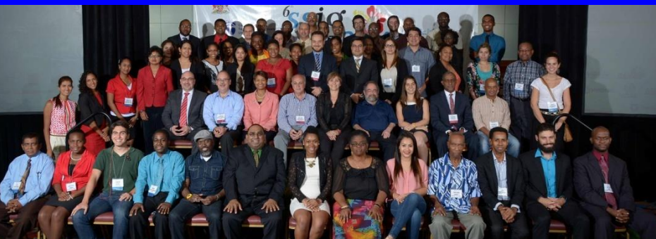
2014 Trinidad & Tobago