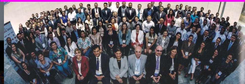
2015 Costa Rica