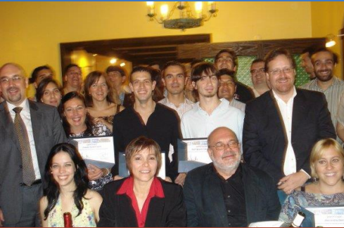
2009 Buenos Aires