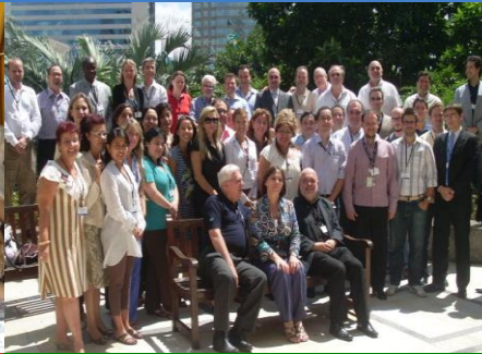
2010 Sao Paulo