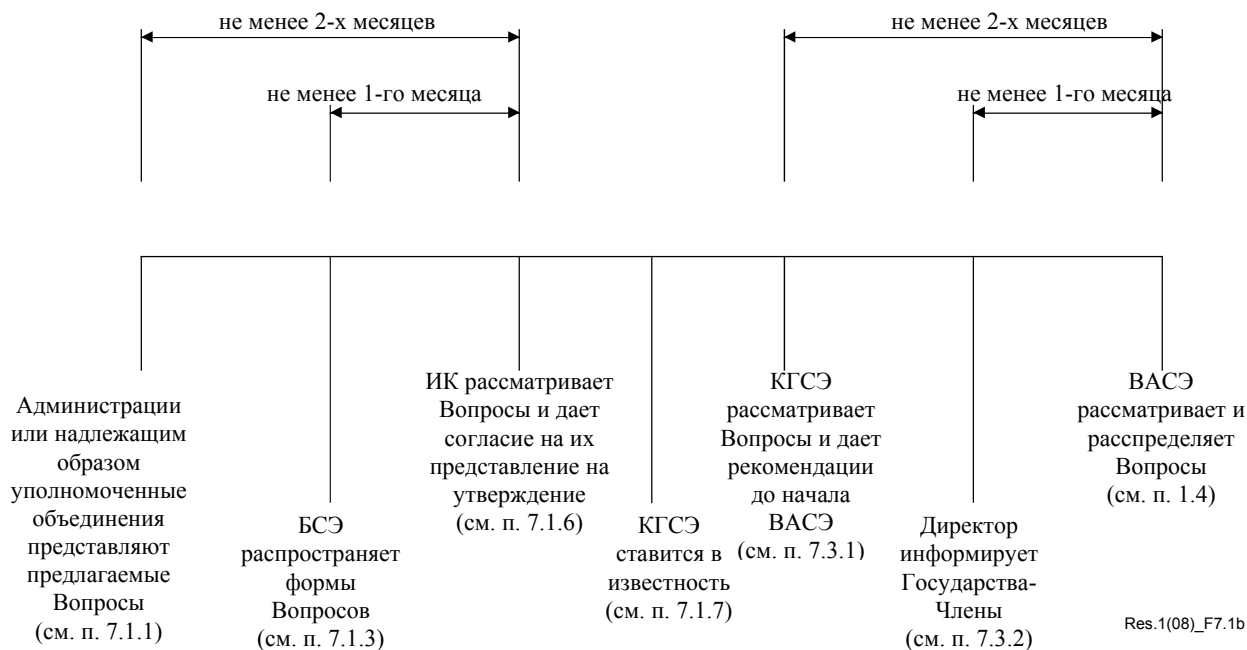
Рисунок 7.1b – Утверждение Вопросов на ВАСЭ