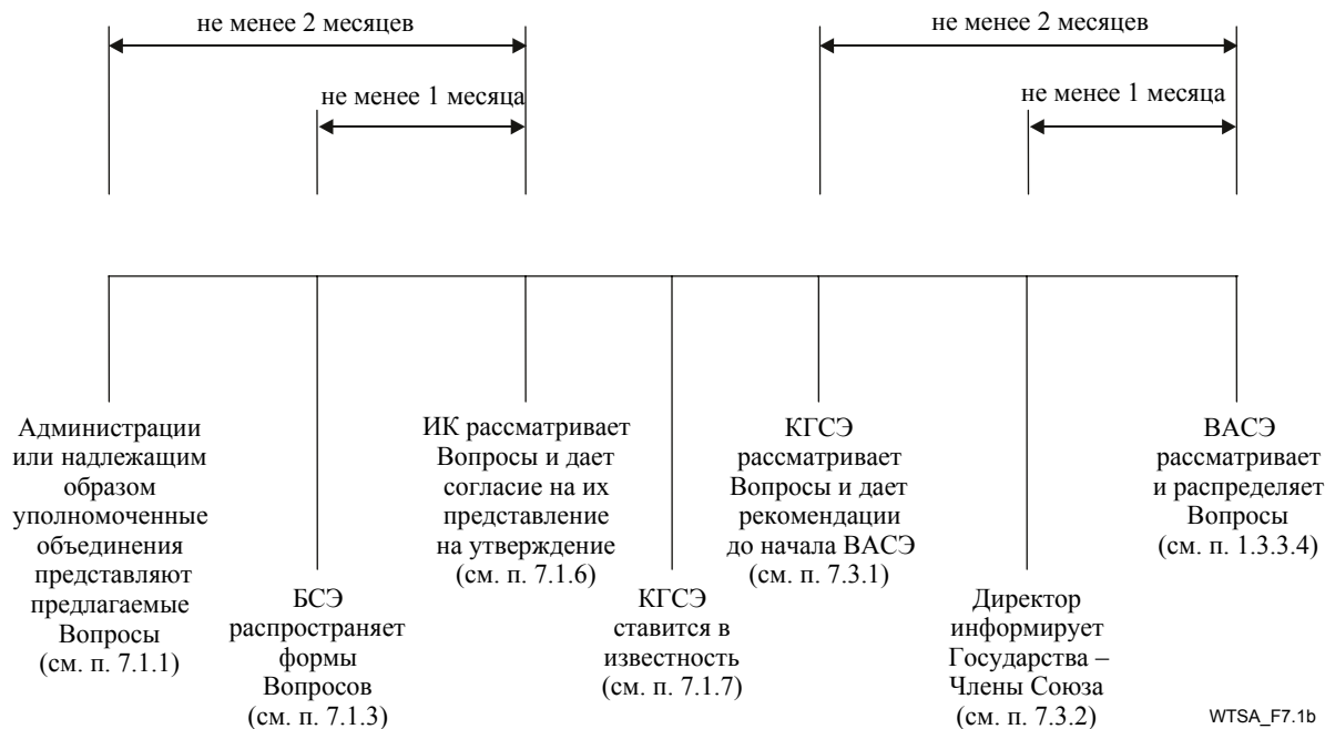
Рисунок 7.1b Утверждение Вопросов на ВАСЭ