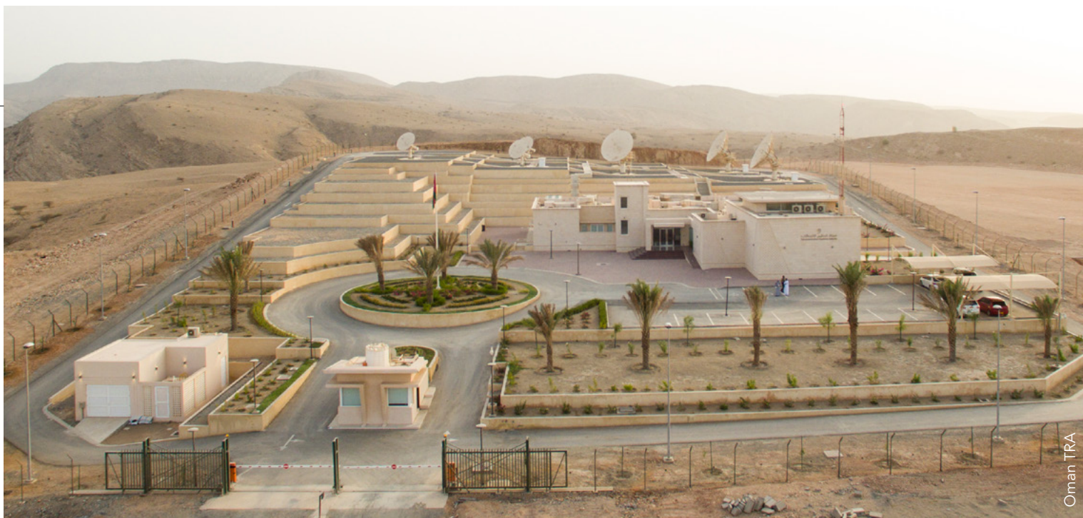
محطة المراقبة الراديوية للخدمات الفضائية، مسقط، عُمان

واعتقاد أن عبء جمع البيانات وتحليلها سرعان ما سيُنقل كواهل الإدارات ليس إلا اعتقاداً واقعياً، الأمر الذي سيؤدي إلى زيادة إطالة مدد عمليات منح التراخيص، أو المزيد من إلغاء التنظيم القانوني في بعض الحالات.