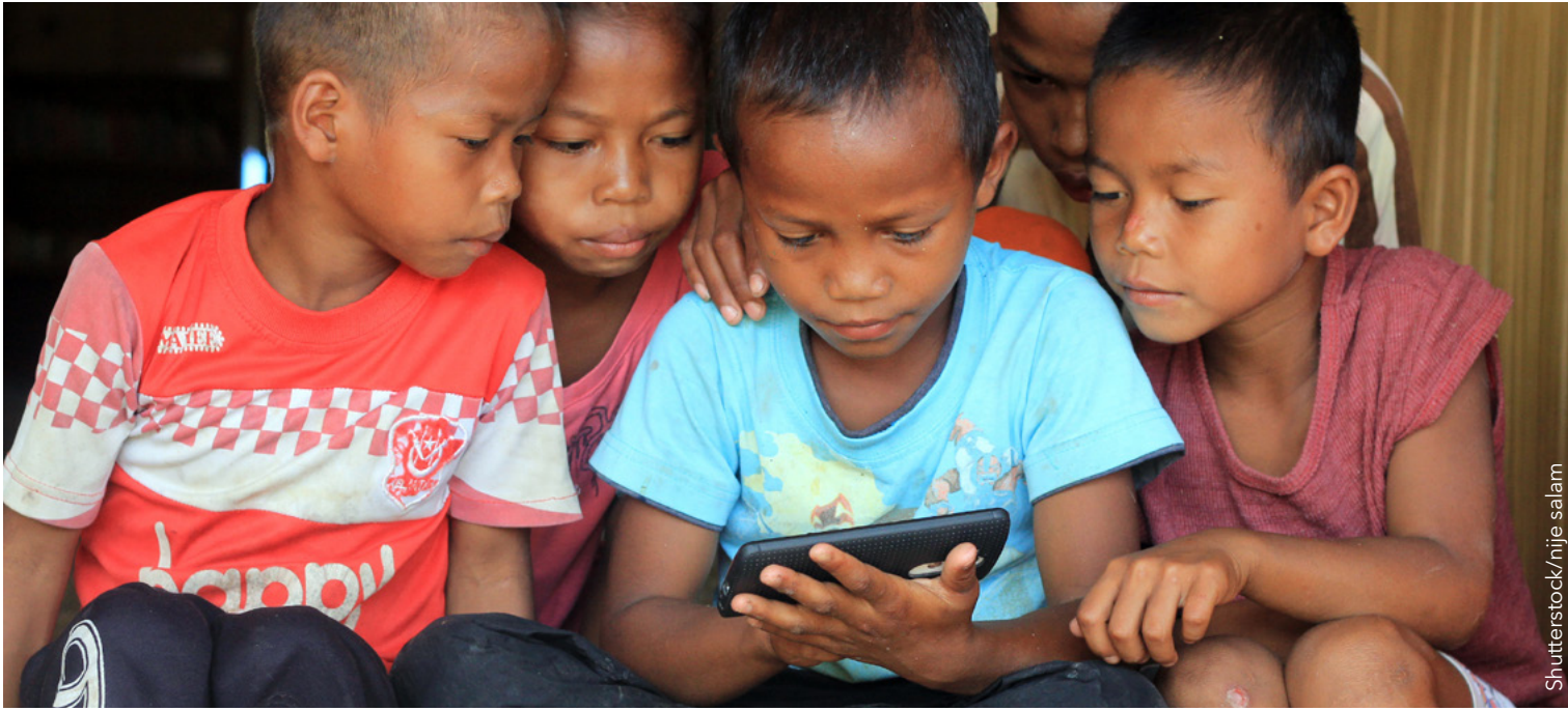
شبكة Wi-Fi مشغلة ساتلياً بسرعة 28 GHz توصل حالياً الملايين من الذين يعيشون في مراكز وقرى حضرية وريفية.

واليوم يمكن لساتل واحد في النطاق 28 GHz أن يُخدّم ثلث كوكب الأرض. وتزود التغطية الواسعة جميع المجتمعات الواقعة ضمن منطقة تغطية الساتل بنفاذ إلى الخدمة. وإلى جانب سهولة نشر مطاريف المستخدم، فإن هذا يعني تمكين المستهلكين والشركات من النفاذ شبه الفوري إلى النطاق العريض من أي مكان بسرعة وبأسعار ميسورة. فيتسنى للناس بث مقاطع تسجيلاتهم الفيديوية المفضلة عبر الإنترنت في المنزل، وخلال تجوالهم في أرجاء المدينة، بل وحتى على متن طائرة. إذ إن تقنية واي فاي (Wi-Fi) المُفعّلة بالسواتل في النطاق 28 GHz توصل الآن بين ملايين الأشخاص القاطنين في المراكز الحضرية والريفية وفي القرى - وهي صلة وصل تقوم بين العديد منهم لأول مرة.