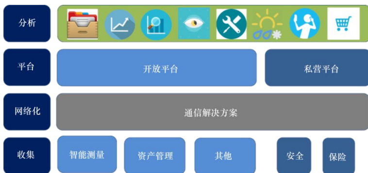
图1：智慧城市中的信息分层架构