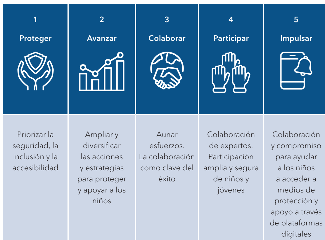
Cuadro 1: Cinco elementos fundamentales de los principios rectores PoP

En esta sección se reseñan los cinco elementos fundamentales de los principios rectores PoP y la pertinencia específica de cada uno de ellos con respecto a los encargados de la formulación de políticas, las plataformas de tecnología digital y los centros de asistencia infantil y servicios análogos.