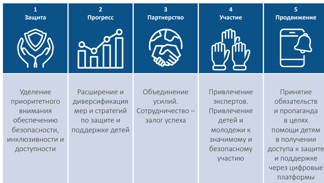
Таблица 1: 5Р руководящих принципов РоР

В данном разделе изложены 5Р руководящих принципов РоР, а также их конкретное значение для директивных органов, цифровых технологических платформ, а также горячих линий помощи детям и других подобных служб.