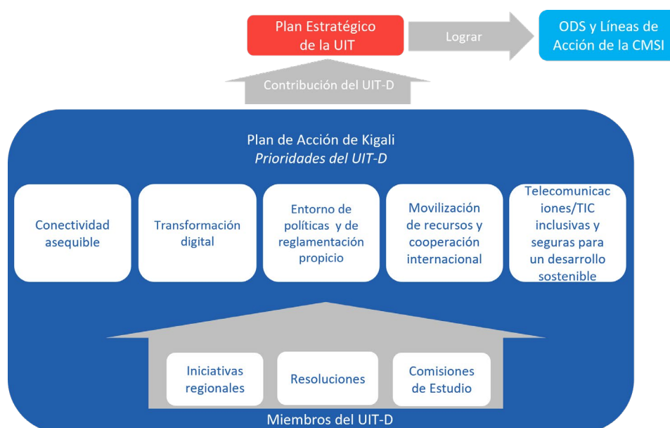
Figura 2.1: Estructura del Plan de Acción de Kigali y su contribución al Plan Estratégico de la UIT

Los resultados del UIT-D y los correspondientes IFR se detallan en el Plan Operacional del UIT-D, teniendo en cuenta la experiencia en la aplicación del Plan de Acción de Buenos Aires. El GADT elaborará en el nuevo ciclo IFR cuantificables para cada resultado del Plan de Acción de Kigali.