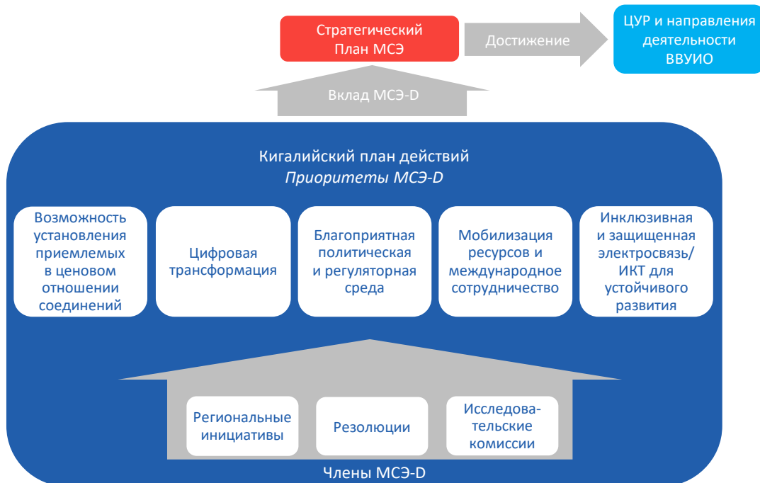
Рисунок 2.1: Структура Кигалийского плана действий и его вклад в Стратегический план МСЭ

Намеченные результаты деятельности МСЭ-D и соответствующие КПИ дополнительно конкретизируются в Оперативном плане МСЭ-D с учетом опыта осуществления Плана действий Буэнос-Айреса. Измеряемые КПИ для каждого конечного результата Кигалийского плана действий должны быть разработаны КГРЭ в новом цикле.