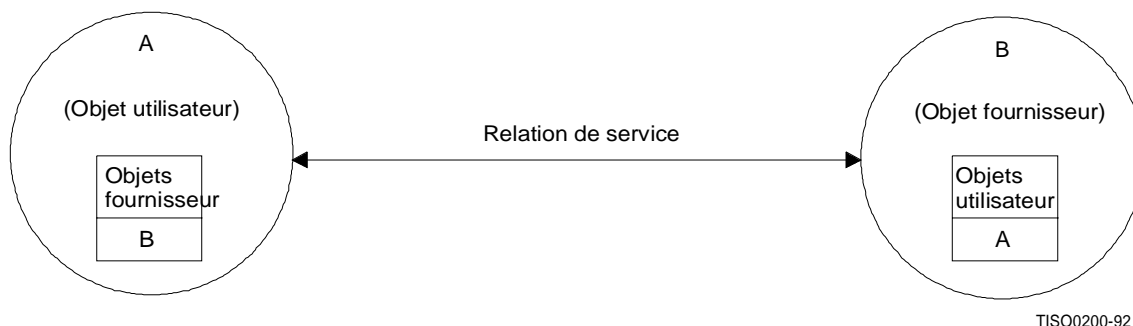
Figure 2 – Rôles des relations

La figure 2 montre une relation de service comprenant deux objets gérés, l'un dans un rôle de fournisseur de service, l'autre dans un rôle d'usager du service.