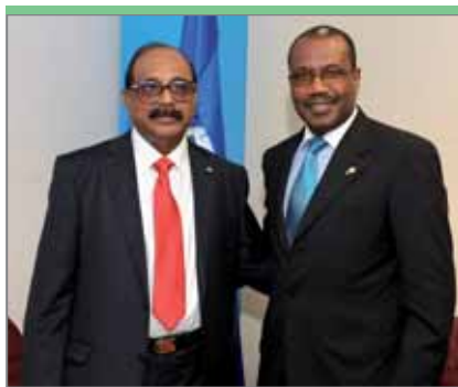
Раджиуддин Ахмед Раджу, министр почты и электросвязи Бангладеш