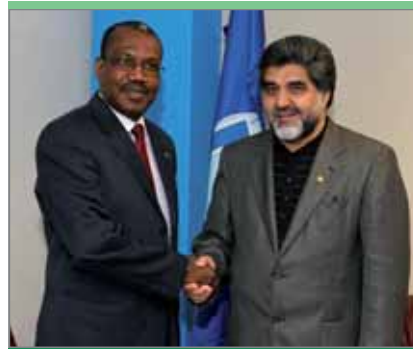
Реза Тагипур Анвари, министр информационно-коммуникационных технологий Исламской Республики Иран