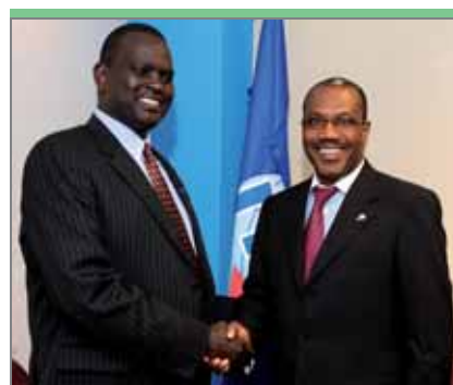
Самуэль Лесурон Погисио, министр информации и связи Кении