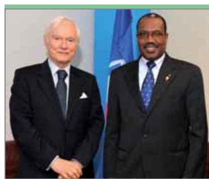
Идрис Джазаири, посол Алжира