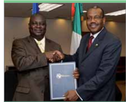
Ндонго Диао, генеральный директор регуляторного органа электросвязи и почты (ARTP) Сенегала. Г-н Диао и д-р Хамадун Туре в Гвадалахаре после подписания меморандума о взаимопонимании в связи с проведением Глобального симпозиума для регуляторных органов 2010 года и Глобального форума руководителей отрасли в Дакаре, Сенегал