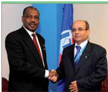
Машхур Абудакка, министр электросвязи и информационных технологий Палестины