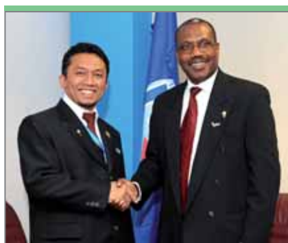
Тифатул Сембиринг, министр связи и информационных технологий Индонезии