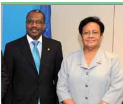
Есета Фуситуа, министр информации и связи Тонга