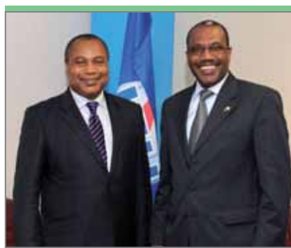
Юджин Джувах, исполнительный заместитель председателя/главный исполнительный директор Комиссии по связи Нигерии