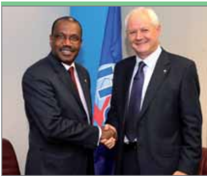
Бернардо Лоренцо Альмендрос, министр по вопросам электросвязи и информационного общества Испании