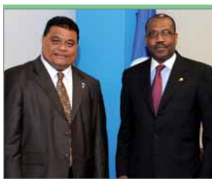
Франсис Итимаи, секретарь (министр) транспорта, связи и инфраструктуры Микронезии