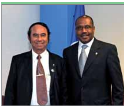
Хун Со, министр почты и электросвязи Камбоджи