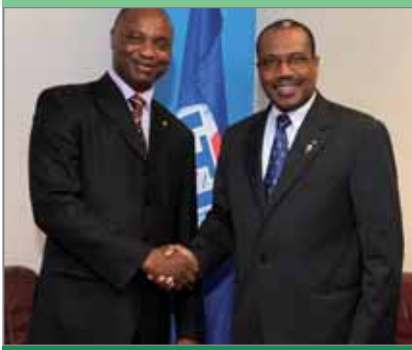
Тьерри Савонароле Малейомбо, министр почты и электросвязи, ответственный за вопросы новых технологий Центральноафриканской Республики