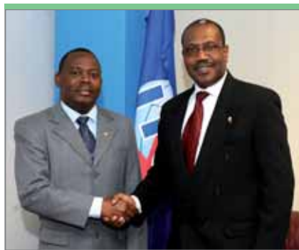
Зусебио Саиде, заместитель министра транспорта и связи Мозамбика