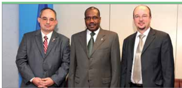
Кресо Антонович, генеральный директор в министерстве моря, транспорта и инфраструктуры (слева) Хорватии; и Дражен Лючич, директор агентства почты и электронных средств связи Хорватии (справа)