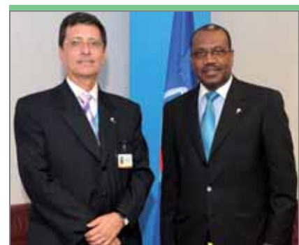
Хаиме Герреро, министр электросвязи и информационного общества Эквадора