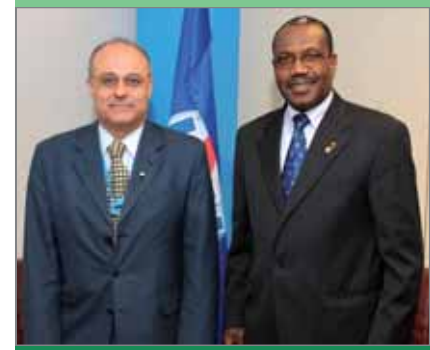
Имад Сабун, министр связи и технологий Сирийской Арабской Республики