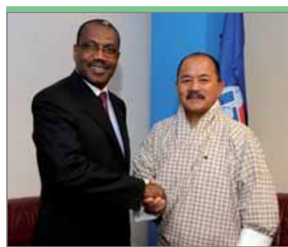
Лионпо Нандалал Раи, министр информации и связи Бутана