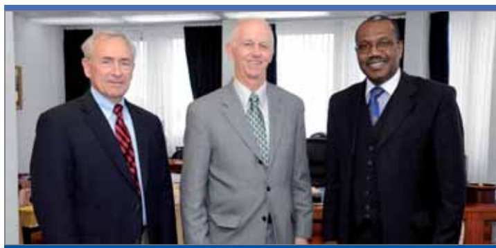
Ален Поттер, председатель Федерального кредитного союза Организации Объединенных Наций (UNFCU); и Майкл Коннери, главный исполнительный директор и президент UNFCU.