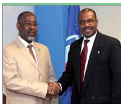
Ходхоер Инзуддин, министр почты и электросвязи Коморских Островов, ответственный за вопросы связи и содействия развитию новых информационных технологий