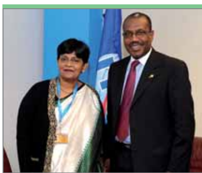
Виджайалакшми К. Гупта, член (финансы) комиссии по электросвязи департамента электросвязи министерства связи и информационных технологий Индии