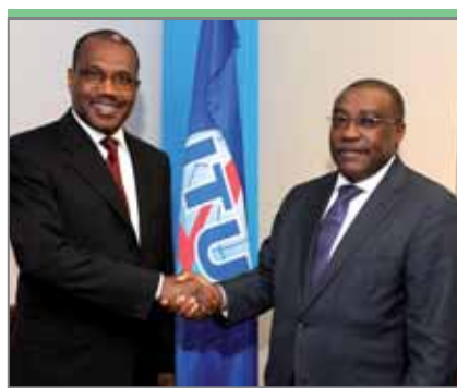
Педро Себастьян Тета, заместитель министра электросвязи и информационных технологий Анголы