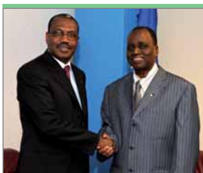
Талибе Диалло, министр электросвязи и новых информационно-коммуникационных технологий Гвинеи