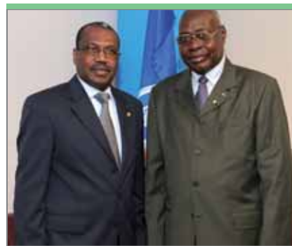
Жан Бавуаё Алинг, министр почты и информационно-коммуникационных технологий Чада