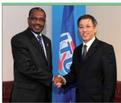
Нам Тханг Ле, заместитель министра информации и связи Вьетнама