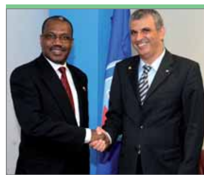
Моше Кахалон, министр связи Израиля