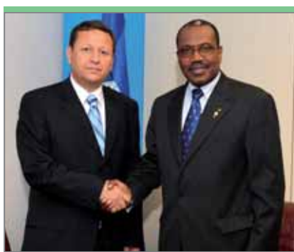
Веселин Божков, председатель комиссии по регулированию в области связи Болгарии