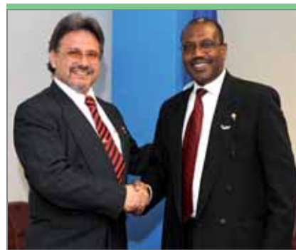
Хорхе Сеам Сасиаин, председатель Национальной комиссии электросвязи Парагвая (CONATEL)