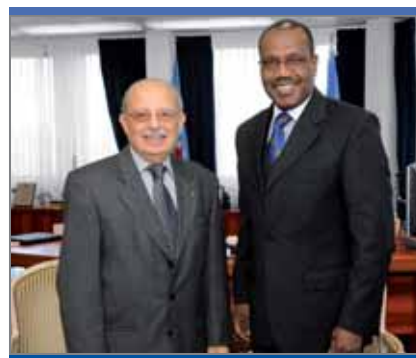
Слиман Чих, посол Организации Исламская конференция