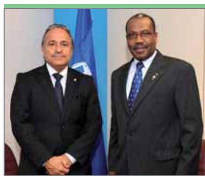
Ришар Буаден, генеральный секретарь, ответственный за подготовку к Полномочной конференции, министерство иностранных и европейских дел Франции