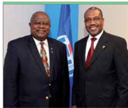
Гидеон Кварку, заместитель министра связи Ганы