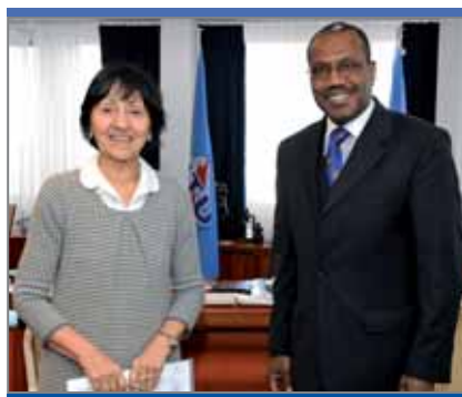
Лаура Миракиан, посол Италии