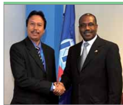
Педро Лай да SILVA, министр инфраструктуры Тимор-Лешти