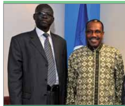
Мадут Баир Йель Акуеи, государственный министр связи и почтовых служб, правительство Южного Судана, Судан