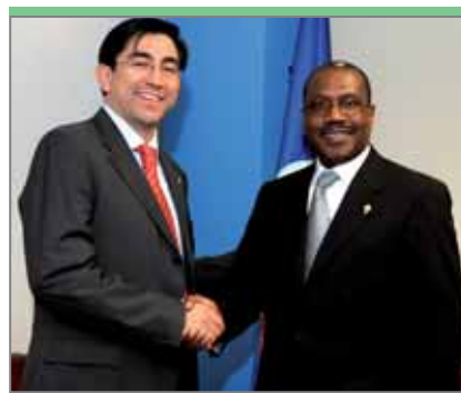
Диего Молано, министр информационно-коммуникационных технологий Колумбии