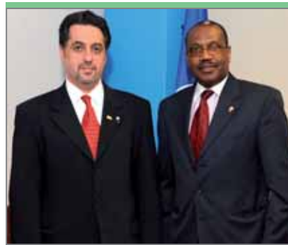
Абдулмохсен Аль-Мазиди, заместитель министра по вопросам связи Кувейта