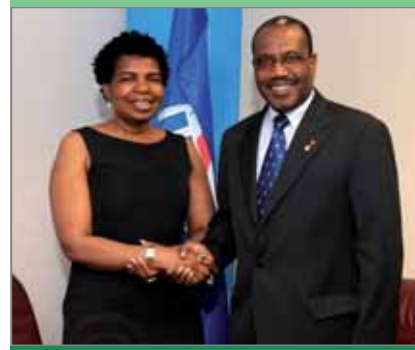
Дина Деливе Пьюл, заместитель министра связи Южной Африки