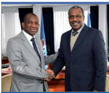
Кабине Комара, бывший премьер-министр Гвинеи