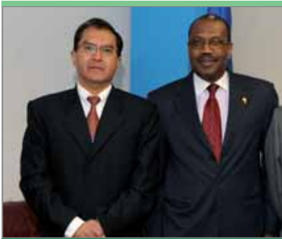
Вильбер Сальвадор Флорес Бустимос, исполняющий обязанности заместителя министра по вопросам электросвязи, министерство общественных работ, услуг и жилищного строительства Боливии