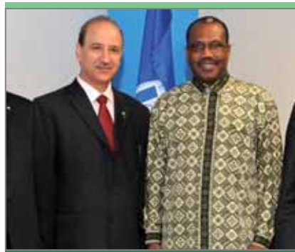
Амир Хадр, заместитель министра связи Ирака