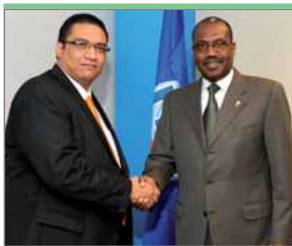
Гелбин Рафаэль Понсе Розалес, уполномоченный в национальной комиссии по электросвязи Гондураса, Comisión Nacional de Telecomunicaciones (CONATEL)