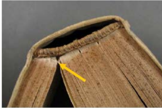
BGE –Nf 106 Tranchefile supérieure