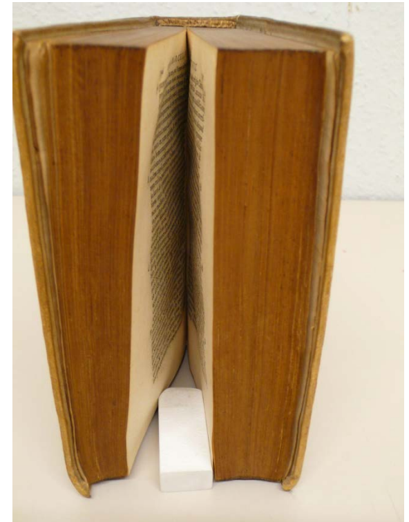
BGE – Gb 367 ouverture très serrée, très difficile à numériser