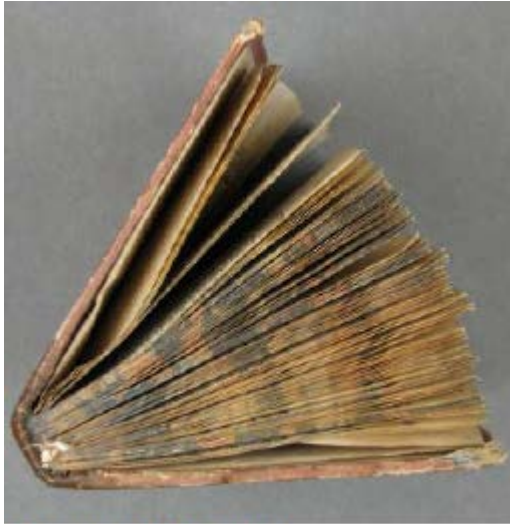
BGE –Bd 1467 dos forcé