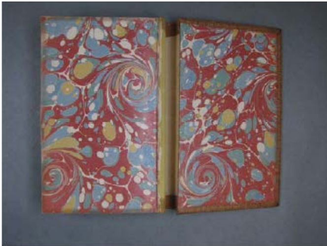
BGE – S2598 charnière intérieure cassée