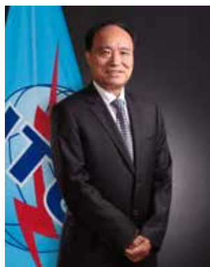
Хоулинь Чжао, Генеральный секретарь МСЭ, Март 2015 года

Имею честь представить Стратегический План Союза на 2016–2019 годы.