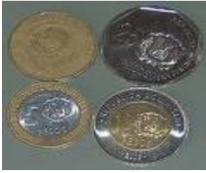
Monedas de 1, 5, 10 y 25 pesos