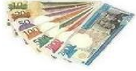
Billetes de 10, 20, 50, 100, 500, 1000 y 2000 pesos.