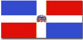
Bandera de la Rep. Dominicana