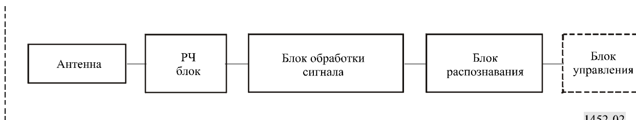
Схема радара малого радиуса действия для автотранспортных средств