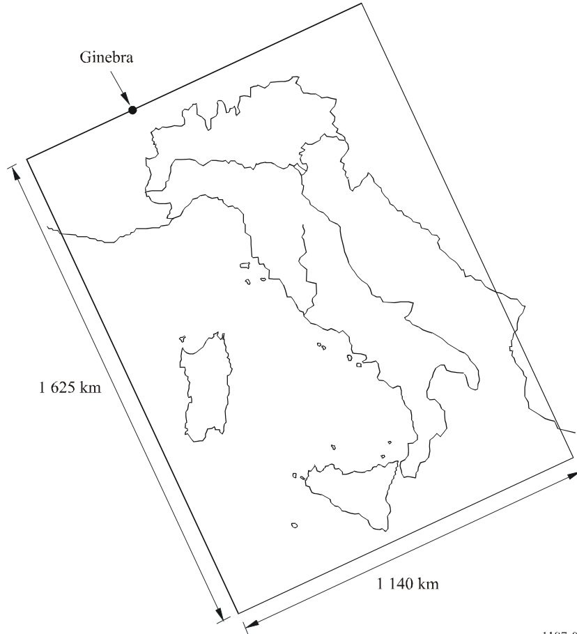
FIGURA 3 Zona subsatelital activa ficticia para Italia

ejemplo es Italia y la Fig. 3 ilustra la zona subsatelital necesaria para dar servicio al país con un sistema móvil por satélite LEO A (Recomendación UIT-R M.1184).