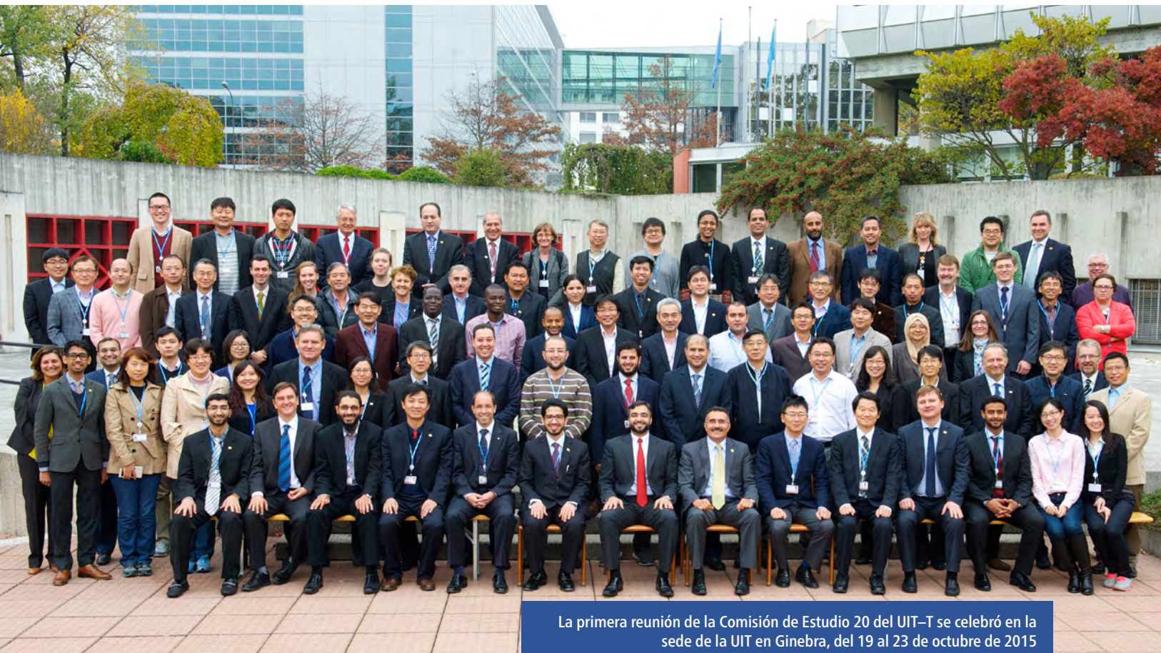
La primera reunión de la Comisión de Estudio 20 del UIT-T se celebró en la sede de la UIT en Ginebra, del 19 al 23 de octubre de 2015

Comisión de Estudio 20 del UIT-T: Una nueva colaboración