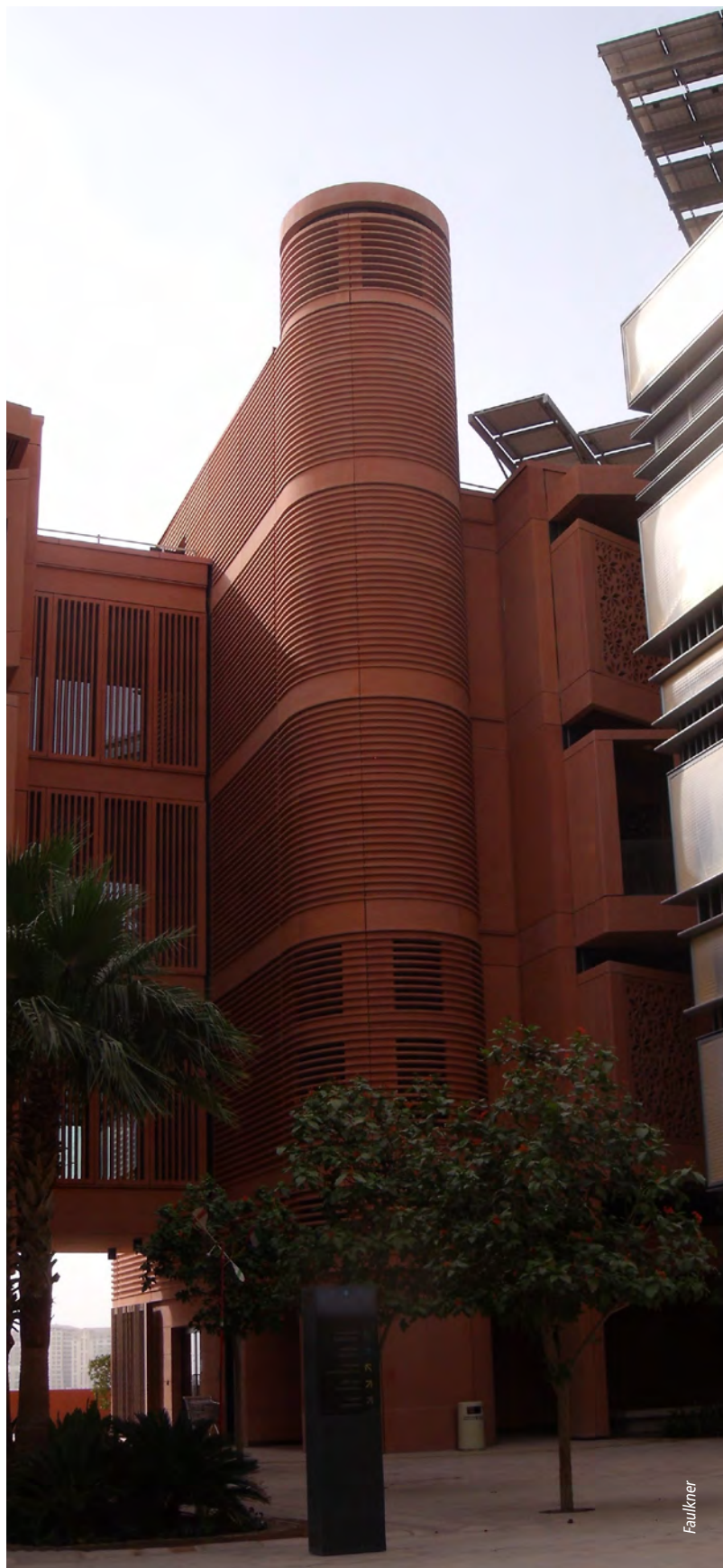
Masdar City, una ciudad inteligente en los Emiratos Árabes Unidos

"Una ciudad inteligente y sostenible" es una ciudad innovadora que aprovecha las tecnologías de la información y la comunicación (TIC) y otros medios para mejorar la calidad de vida, la eficiencia del funcionamiento y los servicios urbanos y la competitividad, al tiempo que se asegura de que responde a las necesidades de las generaciones presente y futuras en lo que respecta a los aspectos económicos, sociales y medioambientales.