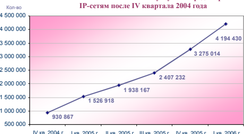
Изменение количества абонентов услуг по передаче речи по IP-сетям после IV квартала 2004 года