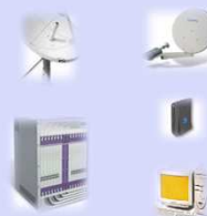
Управление и эксплуатация

ПРОВЕДЕНИЕ МЕЖДУНАРОДНО-ПРАВОВОЙ ЗАЩИТЫ ОРБИТАЛЬНО-ЧАСТОТНОГО РЕСУРСА СПУТНИКОВОЙ СИСТЕМЫ