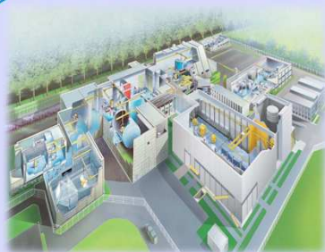
Разработка и производство