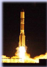
Вывод на ГСО